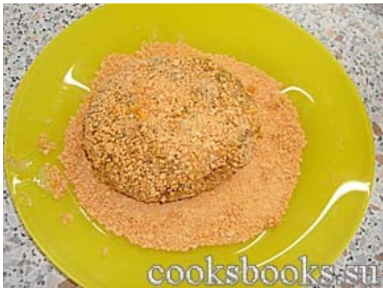
Котлетка с сыром.

14.04.09 17:44 - Последнее обновление 03.02.10 05:50